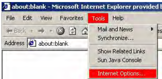
Internet Explorer 6