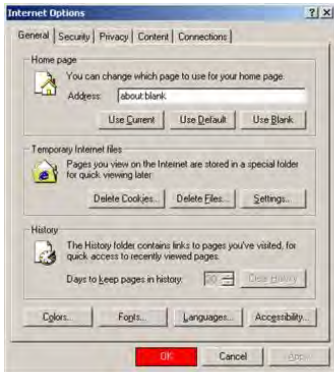
Internet Explorer 6